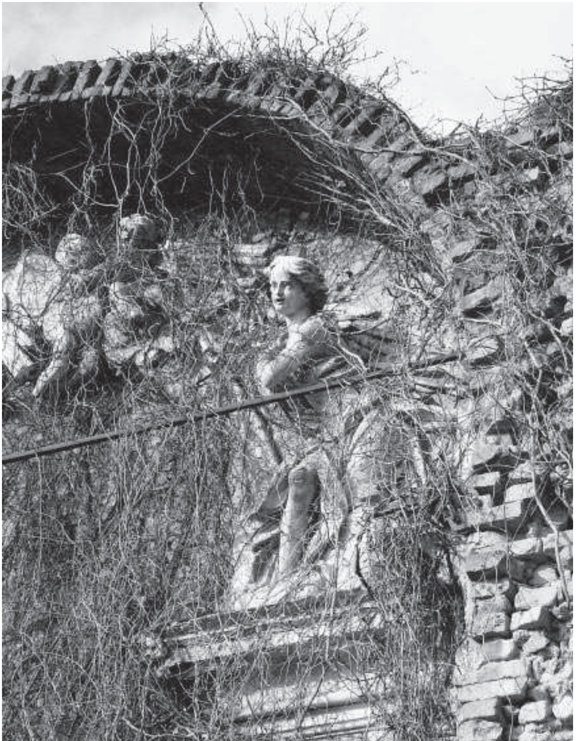
Casalmaggiore, ruderi della chiesa di San Rocco.