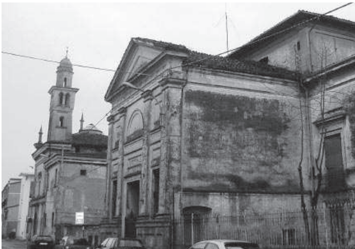
SOPRA, Casalmaggiore (CR), Ex Ospedale, con annessa chiesa di Santa Maria del Popolo.