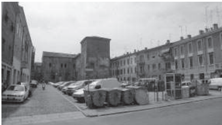
Spazi pubblici privati delle qualità delle piazze storiche: piazza Filippini a Mantova e i parcheggi del centro commerciale "La Favorita".