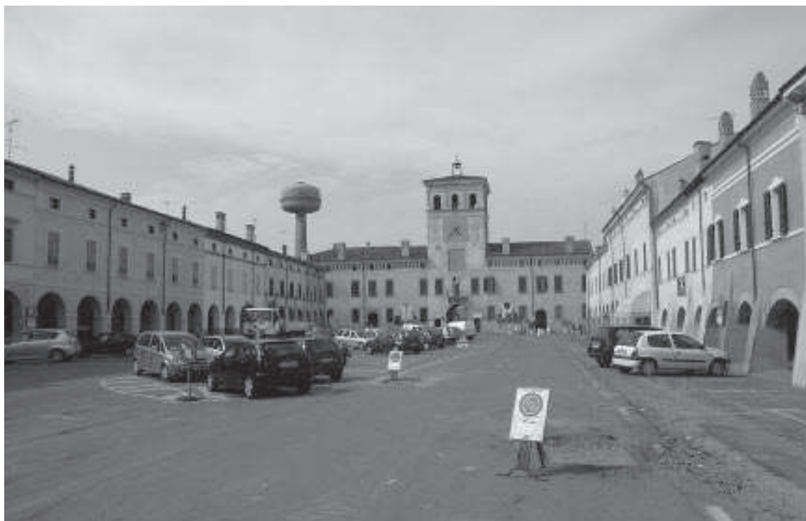
Rivarolo Mantovano, piazza Finzi. IN ALTO, particolare della pavimentazione storica rinvenuta nei recenti sondaggi archeologici.

Piazza Finzi costituisce uno degli esempi meglio riusciti e compiuti di questa volontà per le proporzioni del grande spazio quadrangolare e per l'effetto scenografico dei palazzi che vi prospettano: la mole del cinquecentesco palazzo Penci, la Torre passante dell'orologio, il palazzo Pretorio, il palazzo del Monte di Pietà e i lunghi e profondi portici laterali. La grande piazza nel corso del Novecento ha visto svilire queste sua qualità architettoniche: utilizzata come area di transito e parcheggio, sostituita o ricoperta di asfalto e cemento la pavimentazione originaria in cotto e acciottolato; anche la costruzione della torre dell'acquedotto, non direttamente sulla piazza ma da essa ben visibile ed incongrua, ha con-