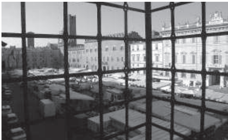
Piazza Sordello a Mantova in giorno di mercato: una delle attività tipiche delle piazze italiane riprende possesso del suo spazio.

Come per l'edilizia storica non bisogna peraltro demonizzare il materiale "moderno" o industriale ma saperlo progettualmente utilizzare con criterio