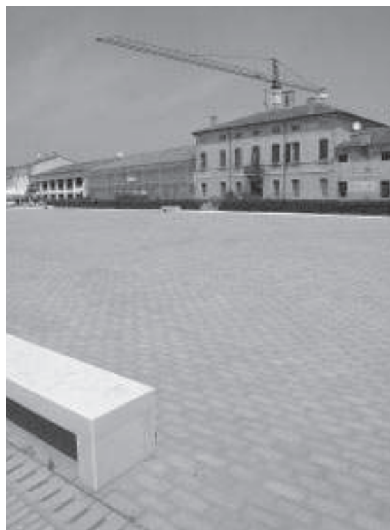
A DESTRA, DALL'ALTO: Roncoferraro, sagrato della chiesa di San Giovanni e piazza di Corte Grande.