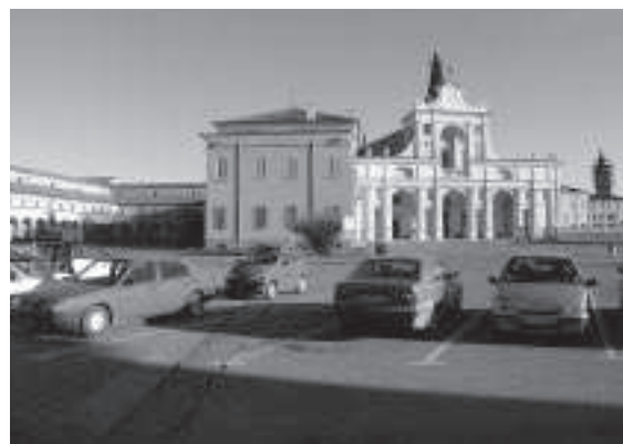
San Benedetto Po. SOPRA, piazza Matilde di Canossa.