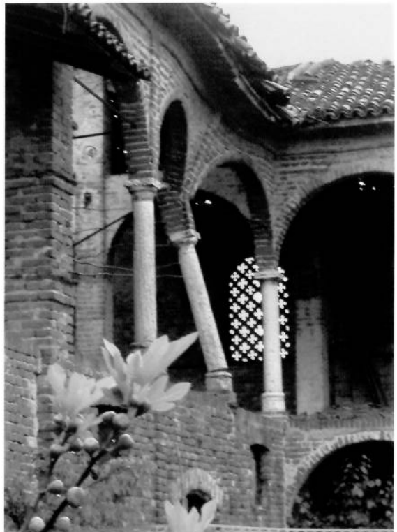
Persico Dosimo, Cascina Acqualunga.

Il castello di Romanengo racconta l'allargarsi deciso dell'influenza della città sul contado nel periodo che comprende quel lungo processo di trasformazione che dal comune porta alle signorie ed infine agli stati regionali. In quello di Padernello è evidente un fenomeno molto frequente nel secolo XV, ossia la trasformazione da fortezza a residenza di campagna. La chiesa di San Pietro a Gazzuolo, "Pantheon" dei Gonzaga di Gazzuolo, probabilmente fondata dalla regina longobarda Ansa, contiene la tomba della famiglia Pico della Mirandola, vissuta qui. Palazzo Fenaroli, Villa Grassetti e Villa