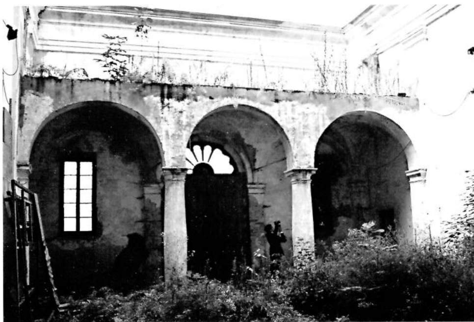
Belforte, chiesa di San Pietro. A LATO, l'evidente stato di abbandono della struttura.

La chiesa fu fondata secondo la tradizione dalla regina longobarda Ansa intorno al 750. Proprietà dei Benedettini di Leno, fu riedificata intorno all'anno 1000, quindi passò ai marchesi Gonzaga di Gazzuolo. Nel 1506 venne donata ai frati di S. Gerolamo di Fiesole, e divenne il "pantheon" di questo ramo dei Gonzaga, come è testimoniato dalle lapidi mortuarie all'interno. Interventi di riparazione sono documentati già a partire dal 1712, anno dell'acquisizione della chiesa da parte dei Gesuiti, che ne saranno proprietari fino alla soppressione dell'Ordine alla fine del XVIII secolo. La chiesa, o quello che rimane di essa, è ora di proprietà del Comune di Gazzuolo.