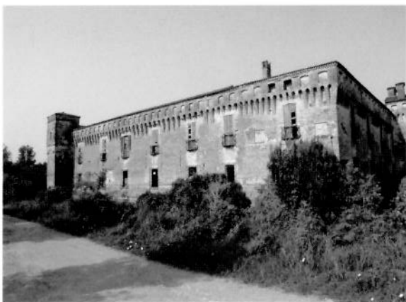
Padernello, Castello Salvadego. SOPRA, particolare del degrado delle strutture.