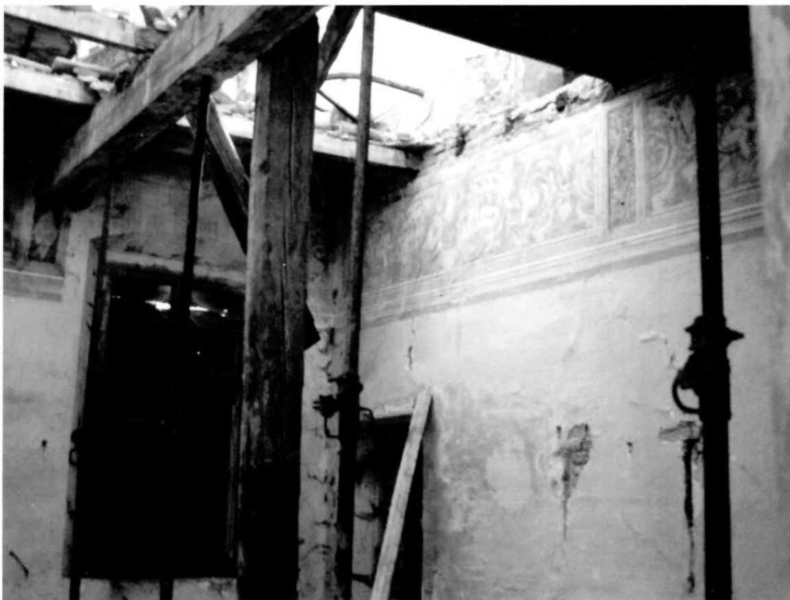
Sailetto, Villa Grassetti. Esterno e particolare dell'interno.