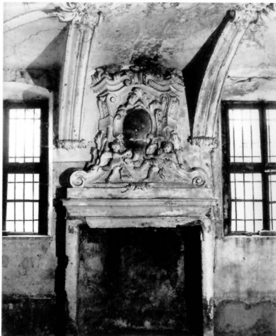
Ostiano, la Sinagoga.

ne locale. Dovrebbero e potrebbero trovar posto quindi i nostri “luoghi della memoria”, attraverso i quali ritrovare la nostra identità culturale. Per raggiungere questo obiettivo sarebbe necessaria una serie di attività volte a far riscoprire e rivalutare il territorio, coinvolgendo quanta più popolazione possibile. Queste attività saranno ovviamente differenziate a seconda del pubblico al quale sono rivolte (collegamenti continui con le strutture scolastiche di ogni livello, quaderni didattici, pubblicazioni a carattere divulgativo, proposte di itinerari, attività di ricerca scientifica, mostre, convegni, eventi, progetti, ecc.). È naturale prendere in considerazione l’idea dell’ecomuseo, un sistema che si basa sulla conservazione dinamica delle opere in correlazione col loro ambiente, processo che approda naturalmente alla valorizzazione del territorio. Potrebbe nascere allora un nuovo tipo di approccio al territorio che promuova anche alternative attività economiche, finalmente in armonia con paesaggio e ambiente.